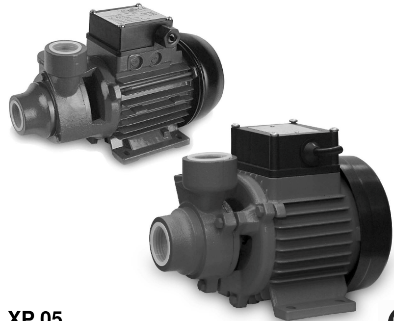
XP 05 XP 05L