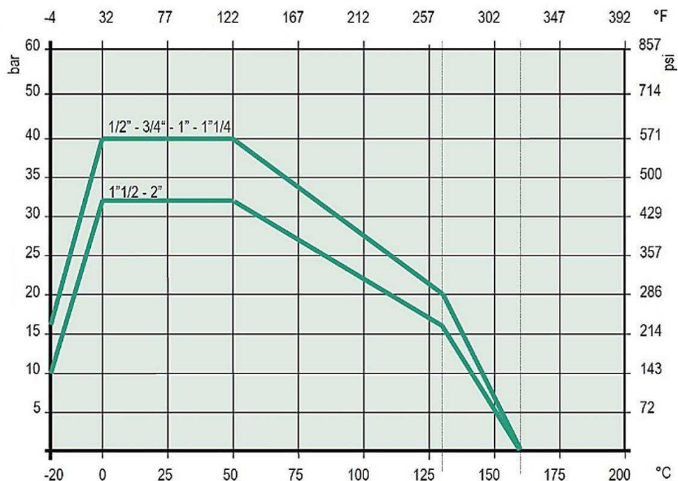
РИС.1.1. ЗАВИСИМОСТЬ РАБОЧЕГО ДАВЛЕНИЯ ОТ ТЕМПЕРАТУРЫ ПЕРЕМЕЩАЕМОЙ СРЕДЫ